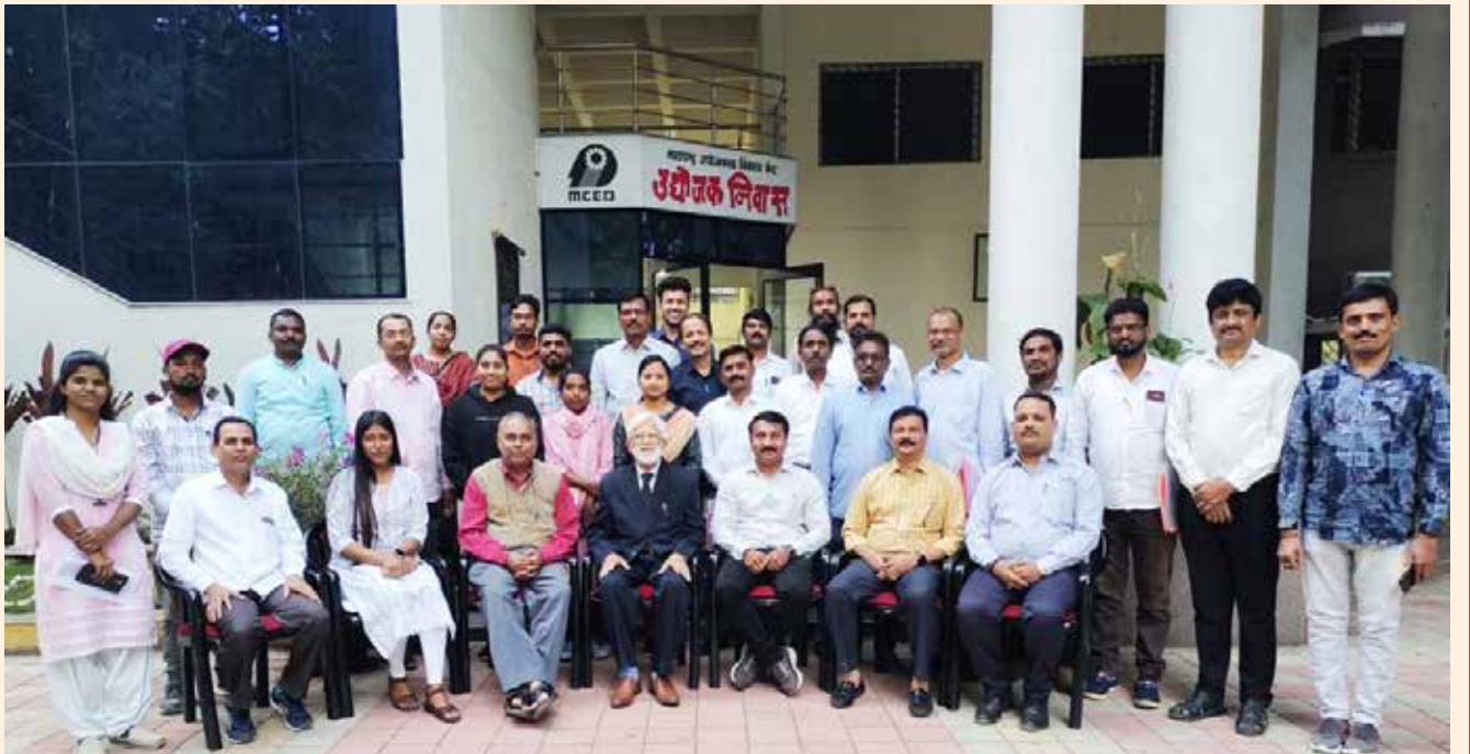
पीएम विश्वकर्मा योजनेअंतर्गत मास्टर ट्रेनर्ससाठी प्रशिक्षणार्थी (मास्टर ट्रेनर) आणि ToT च्या फॅकल्टीज (सुपर ट्रेनर्स) सोबत ग्रुप फोटो. १४ ते १८ डिसेंबर २०२३ दरम्यान एमसीईडी मुख्यालय, छत्रपती संभाजीनगर येथे ६ राज्यांच्या (महाराष्ट्र, मध्य प्रदेश, उत्तर प्रदेश, कर्नाटक, ओडिशा आणि छत्तीसगढ़) सहभागासह राष्ट्रीय स्तरावरील कार्यक्रम आयोजित केला गेला.